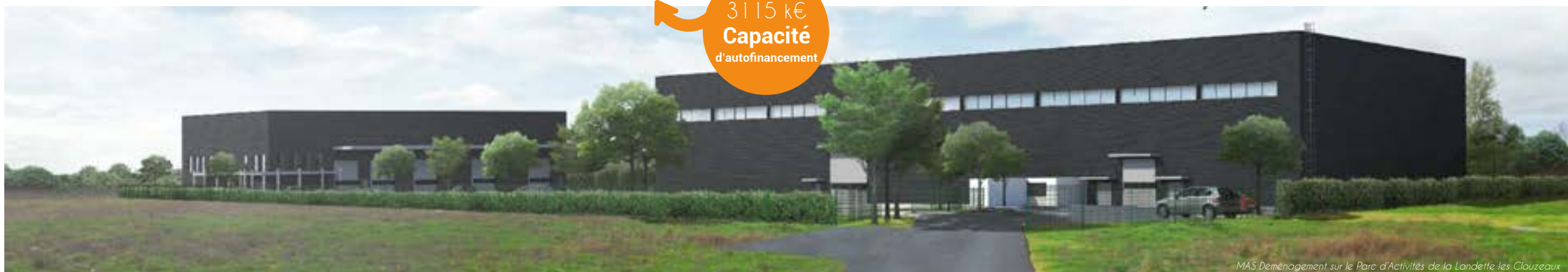
MAS Déménagement sur le Parc d'Activités de la Landette, les Clouzeaux

Un stock de plus de 100 terrains à bâtir